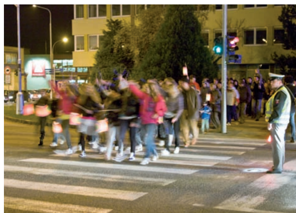
„Lampiónový sprievod“, Hlavná cena, autor: Michal Krištof