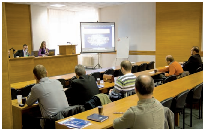
Podnikatelia na seminári