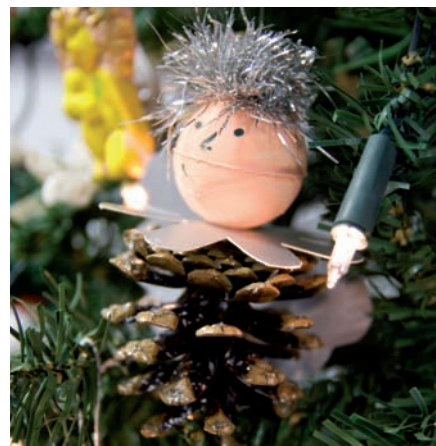
Vianočná ozdoba z Belgicka

Do projektu bolo zapojených spolu 53 základných škôl a 21 ED centier zo všetkých krajín EÚ. Za Slovensko sa tohto projektu zúčastnila Základná škola na Ulici Viliama Paulínyho Tótha v Senici. Žiaci vyrábali pre svojich zahraničných kamarátov