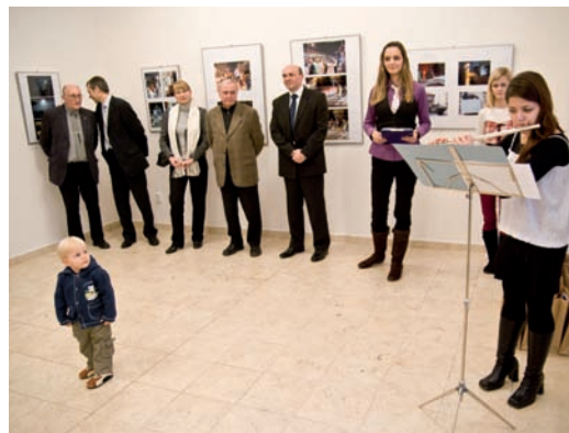
Program na vernisáži zaujal aj najmenších