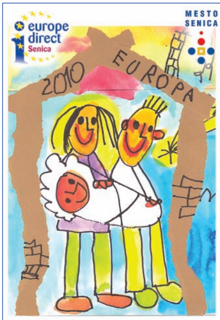
Víťazný návrh kalendárika v kategórii predškôláci