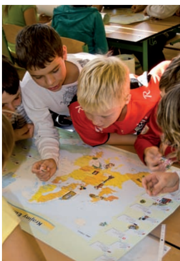
Hľadanie symbolov európskych krajín

zasúťažili v piatich disciplínach, v ktorých si otestovali nielen svoje vedomosti, ale i šikovnosť. A že na menu Euro sú už naozaj zvyknutí, dokázali svojou rýchlosťou pri spoznávaní euro-mincí z rôznych krajín Eurozóny. Na slepej mape a pri hľadaní symbolov jednotlivých štátov a európskych miest predviedli aj zemepisné