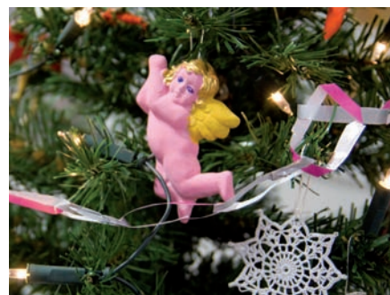
Vianočný anjelik od detí z I. ZŠ Senica