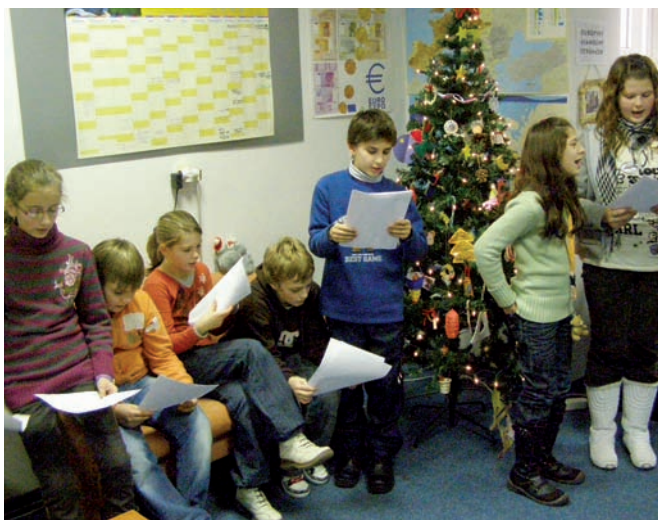
Deti spievajú koledy pri Európskom vianočnom stromčeku

Informačné centrum Europe Direct Senica sa už po druhý krát zapojilo do medzinárodného výmenného projektu „Európske Vianoce“. Cieľom tohto projektu je, aby žiaci na základných školách spoznali jednotlivé krajiny EÚ kreatívnym a zábavným spôsobom. Každá zapojená škola mala za úlohu pripraviť informačný balík s typickými vianočnými tradíciami, receptami, koledami a ozdobami z ich regiónu