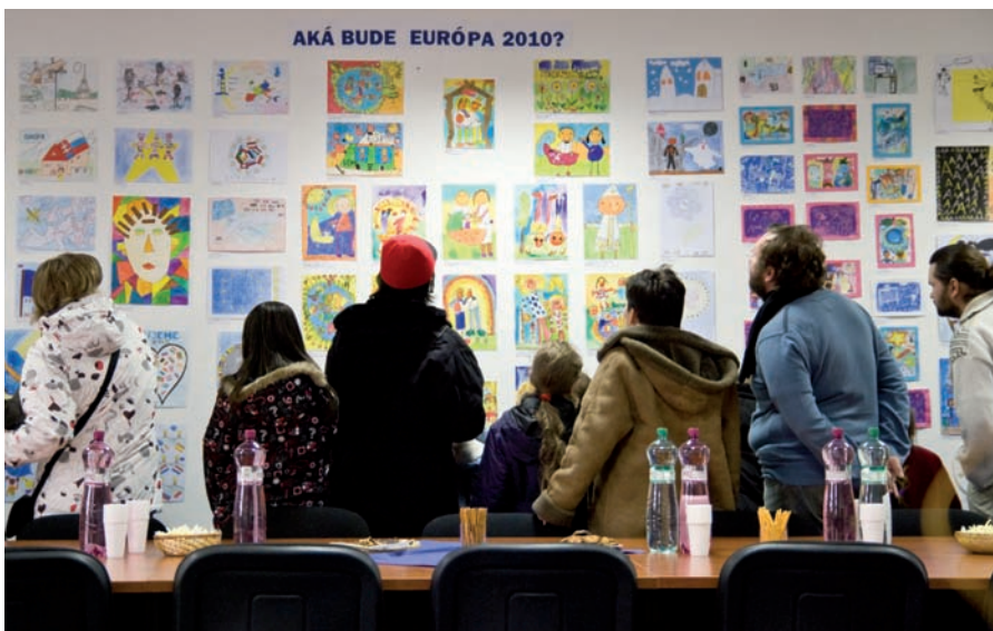
Výstava všetkých súťažných prác v Europe Direct Senica