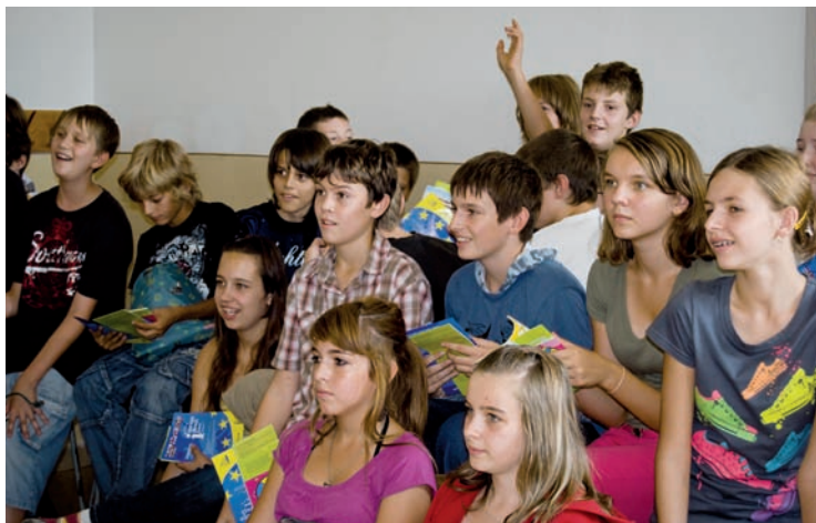
Deň Eura na IV. ZŠ Senica

zručnosti. Nežakli sa ani jazykového kvízu, v ktorom museli uhádnuť pozdrav Ahoj vo viacerých európskych jazykoch. Vo vedomostnom teste o Európskej únii si zase trochu ponámáhali mozgové závitky. Súťažiaci boli za svoje výkony aj odmenení pri záverečnom vyhodnotení, kde tie najlepšie tími dostali vecné ceny od Europe Direct Senica. Nikto však neodchádzal naprázdno. Každý účastník podujatia si odniesol zaujímavé propagačné materiály o EÚ. Okrem toho všetci nadobudli množstvo nových poznatkov a dobrý pocit z netradične stráveného dňa v škole.